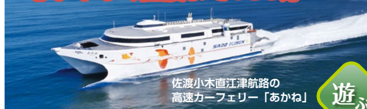
佐渡小木直江津航路の高速カーフェリー「あかね」